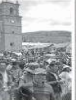
Protestas y bloqueos de la obra de Cacha y Media en la ciudad de Puno, zona de la hidroeléctrica Inambari (verbo 2012).

Después de eso, me ofreció un trabajo de un mes, con un sueldo de 100 dólares por semana para este reportaje y un mes de trabajo.