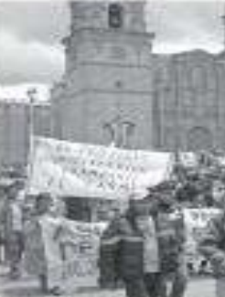
Protestas y bloqueos de la obra de Cacha y Media en la ciudad de Puno, zona de la hidroeléctrica Inambari (verbo 2012).

Después de eso, me ofreció un trabajo de un mes, con un sueldo de 100 dólares por semana para este reportaje y un mes de trabajo.