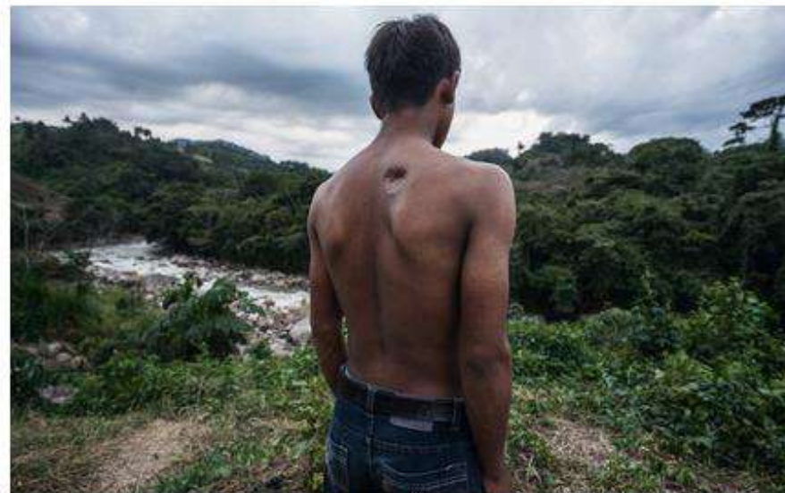
Alan García fue disparado por militares en una protesta para frenar la presa de Agua Zarca.

San José (Costa Rica) - 1 FEB 2017 - 02:42 CET