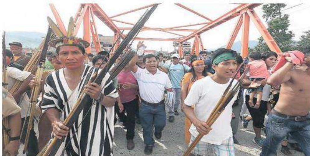
¿Qué desató el conflicto en Pichanaki?

Para entender lo ocurrido en Junín, se deben analizar los problemas de la selva y el discurso radical de los agitadores